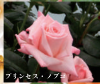
プリンセス・ノブヨ