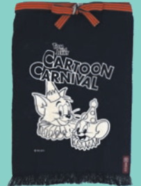
カートゥーン・カーニバル 限定前掛け 6,050円