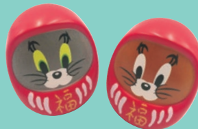
ダルマニアセット 3,300円