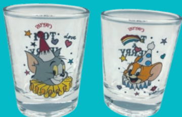
ミニグラス2個セット 1,760円