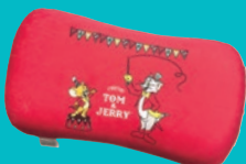
リラックスピロー 2,200円