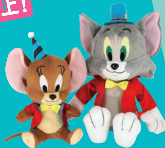
限定ぬいぐるみセット 7,480円