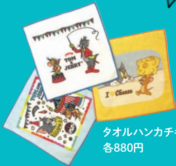
タオルハンカチ各種各880円