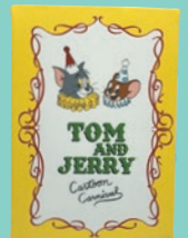
ウォールキャンバスM 3,080円