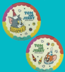
吸水コースター2個セット 1,760円