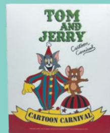
ウォールキャンバスL 4,400円