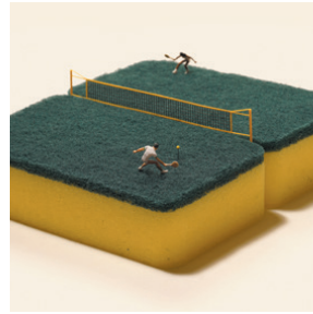
「なんて吸収の早い奴だ!」