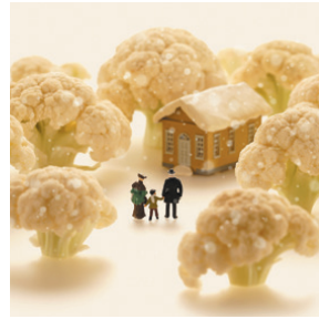
カリフラワー森もり