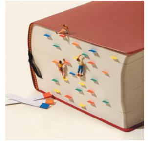
問題の解き方は人それぞれ