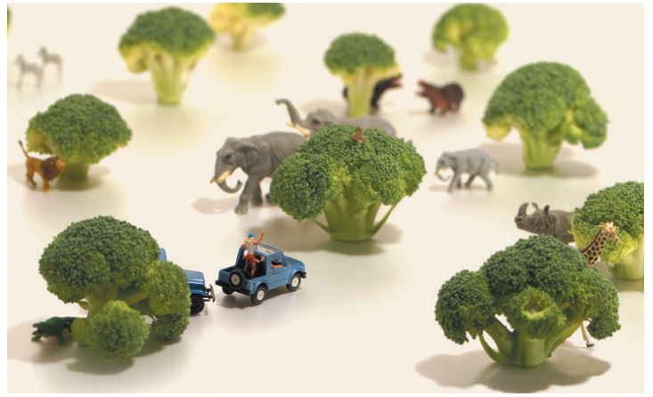
ブロッコリー1本分のサバンナ